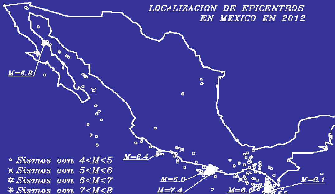
FRECUENCIA DE SISMOS EN 2012