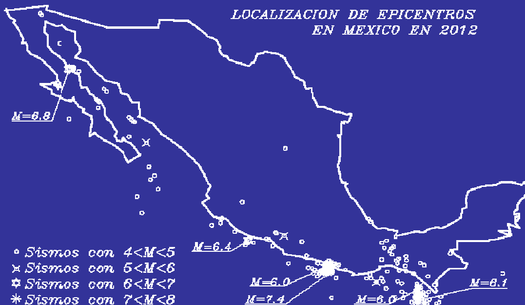
FRECUENCIA DE SISMOS EN 2012