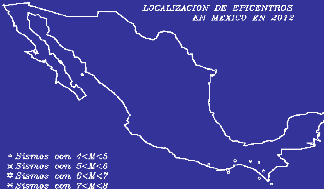
FRECUENCIA DE SISMOS EN 2012