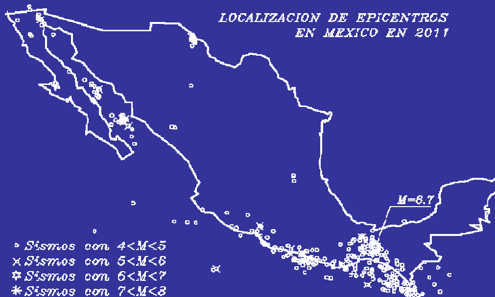
FRECUENCIA DE SISMOS EN 2011