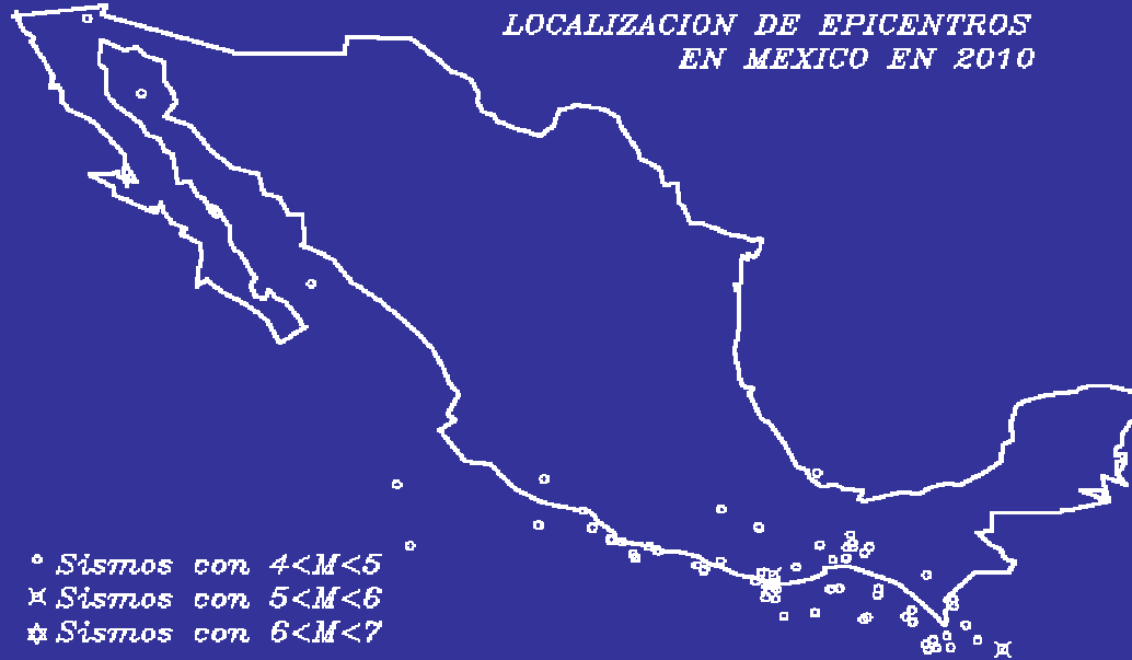
FRECUENCIA DE SISMOS EN 2010