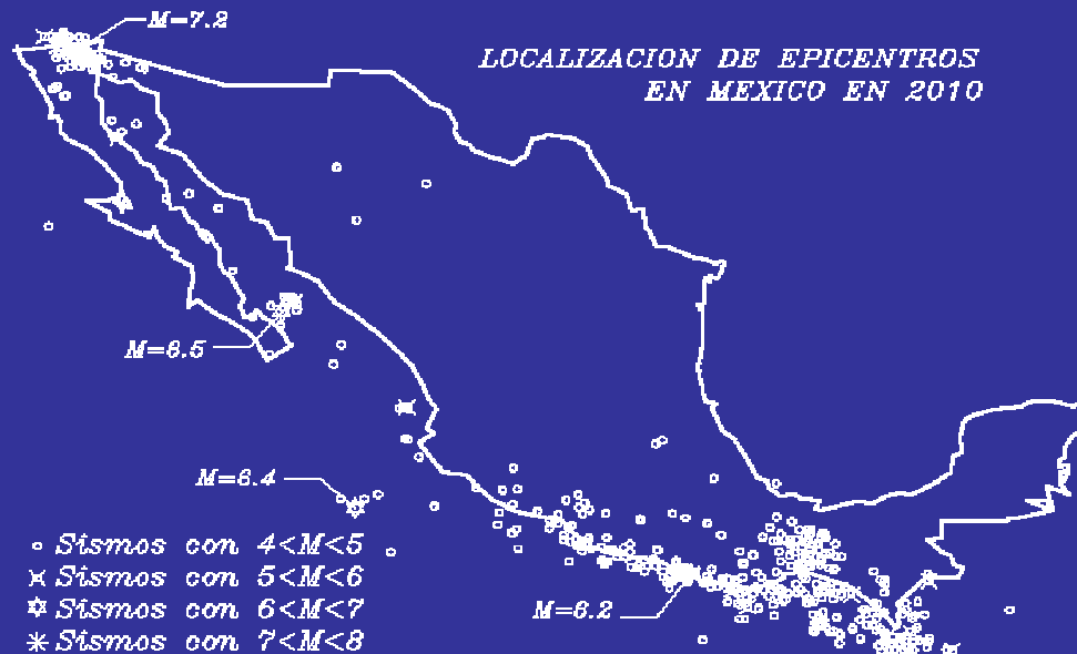
FRECUENCIA DE SISMOS EN 2010