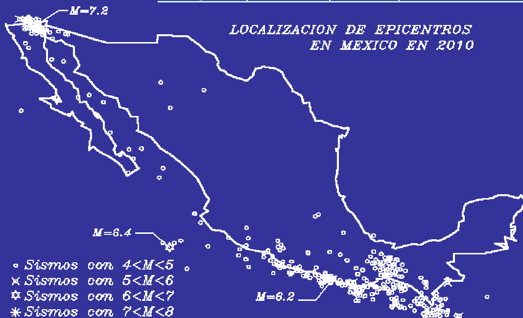
FRECUENCIA DE SISMOS EN 2010