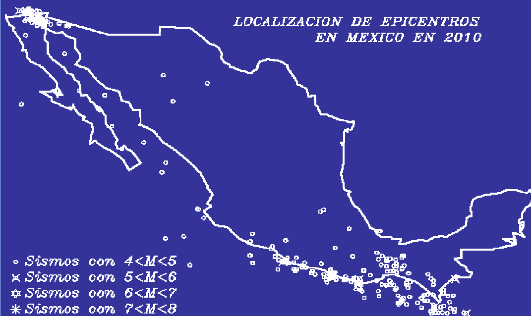
LOCALIZACION DE EPICENTROS EN MEXICO EN 2010