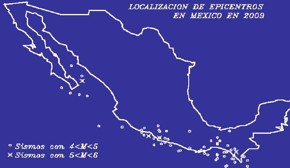
FRECUENCIA DE SISMOS EN 2009