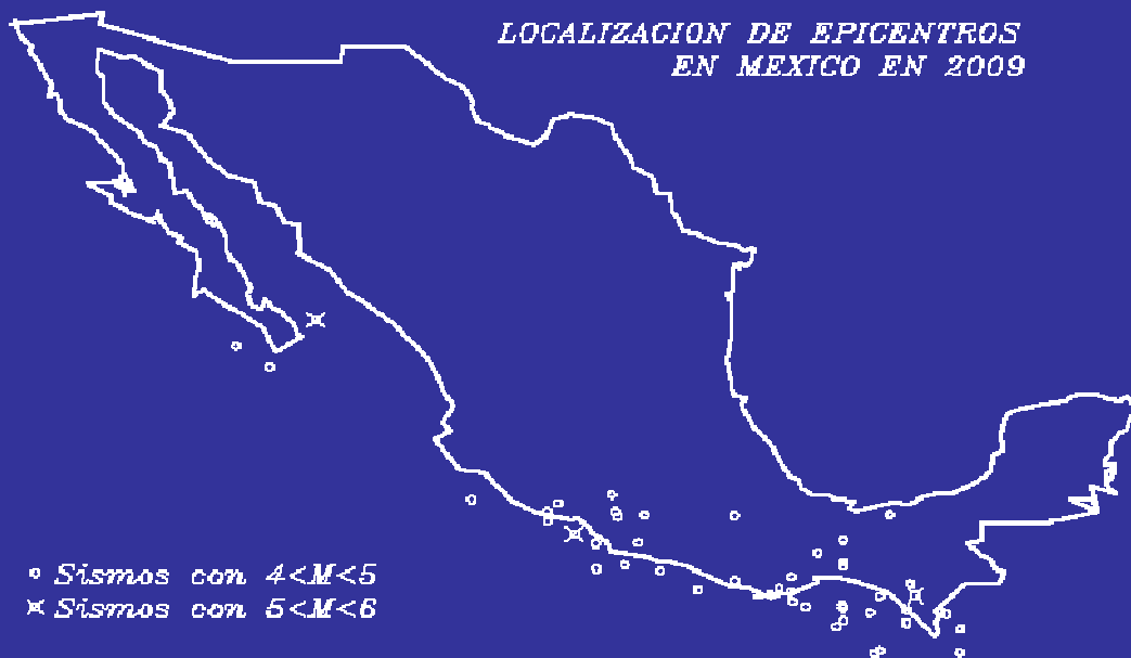
FRECUENCIA DE SISMOS EN 2009