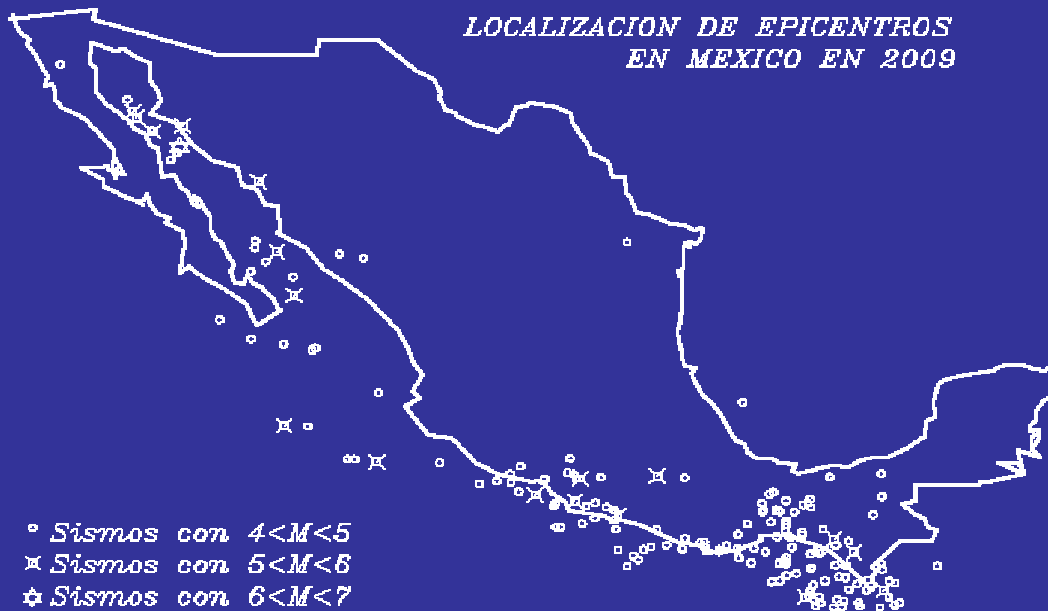
FRECUENCIA DE SISMOS EN 2009